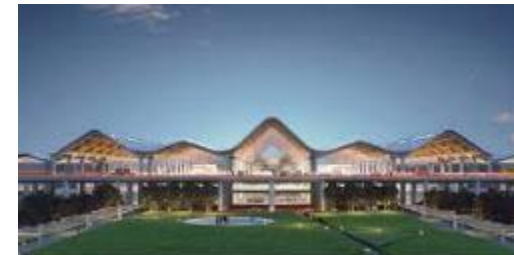
クラーク新国際空港