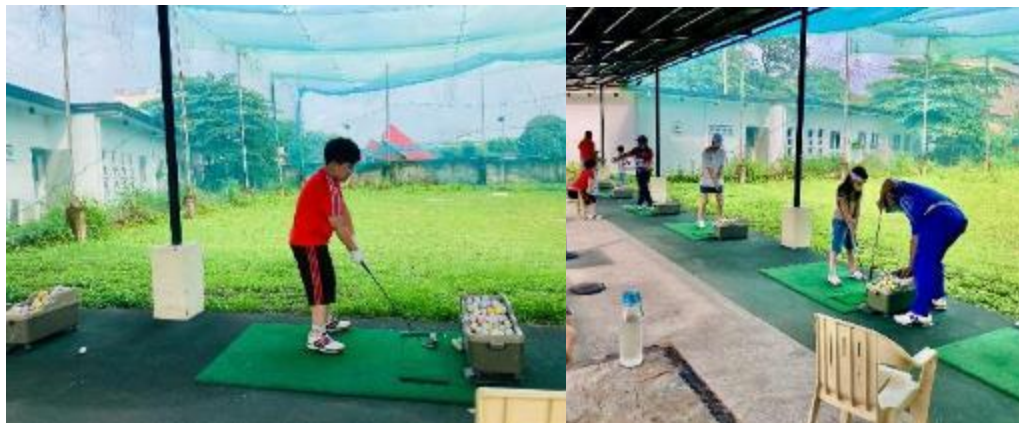
WE ACADEMYキャンパス内のゴルフ練習場