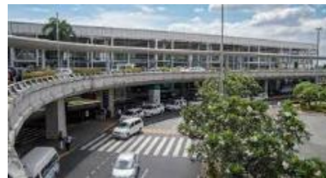
マニラ国際空港（ターミナル2）

コロナ前までもクラーク⇄マニラ北部間は高速道路が開通していたものの、マニラの中心部にあるマニラ国際空港から高速道路路間の渋滞がひどく、マニラ⇄クラーク間は2時間～、渋滞状況によっては4時間かかっていました。その後、2020年に『SKYWAY』という高速道路がマニラ国際空港近くからクラーク間全面開通したことで、現在は安定してマニラ国際空港⇄クラーク間の移動は片道約2時間（最速1時間40分）で可能となっています。