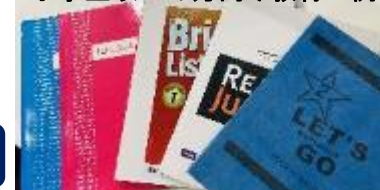
小学生以上の方向け教材一例

当校の親子留学における最大の特徴は、4歳～小学校未就学児の方には毎日のカリキュラムが組まれた幼稚園を自前で保有していることです。同幼稚園では科目ごとに教材・ツールもご用意しており、万一生徒が1人となっても、最低講師とスタッフが計2名以上ついていきますので安心です。小学校～中学3年生のお子様は、講義棟で『JUNIOR ESL COURSE』か欧米ネイティブ講師のマンツーマン授業2コマとグループ授業1コマを含む『JUNIOR ESL NATIVE COURSE』の何れかのコースで学んで頂きます。勿論、教材は幼稚園用・小学生以上用(中学卒業まで)に分かれており、それぞれ豊富にご用意しております。