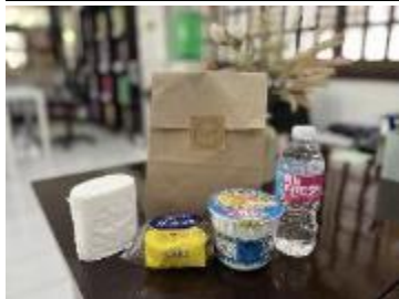
到着時の無料ウェルカムセット